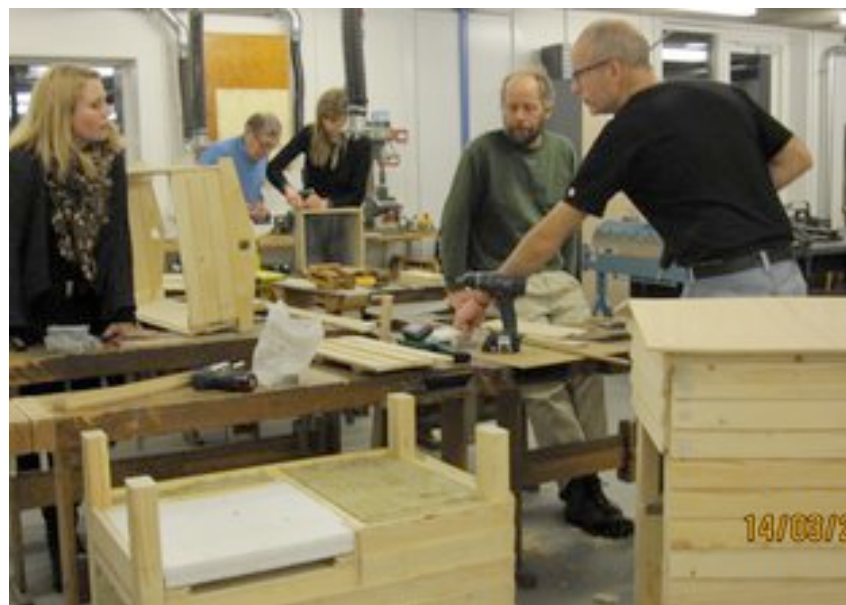
Foto fra bisløjd.