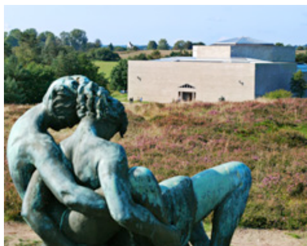
Billede fra skulpturparken med museet i baggrunden.

Chauffører medbring gerne GPS/Kraks kort.