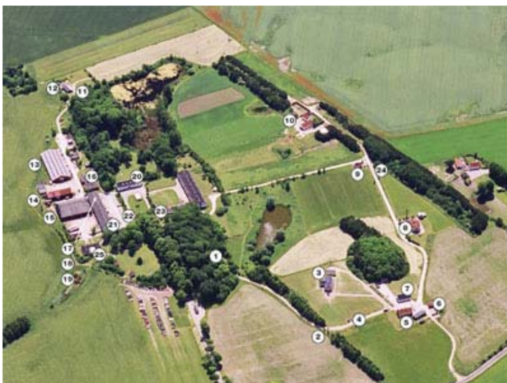
Kort over området

Tanken bag Andelsbevægelsen er ganske enkel, at flere slutter sig sammen om en opgave, den enkelte ikke kan løfte alene. Sammen skaffer man startkapital – bagefter er man fælles om at dele overskud og tab. Man kan altså løse større opgaver og sikre en bedre og mere ensartet kvalitet – eller gennem storindkøb få en bedre pris og større udvalg. Andelstanken slog igennem overalt i Danmark og gav mange nye muligheder. Det betød ikke mindst, at der kom nye arbejdspladser til landsbyerne.