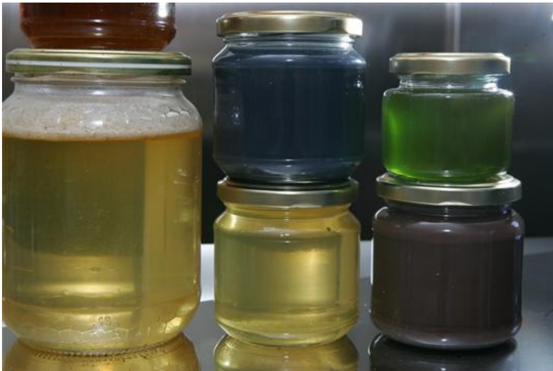
Billede af den kulørte honning